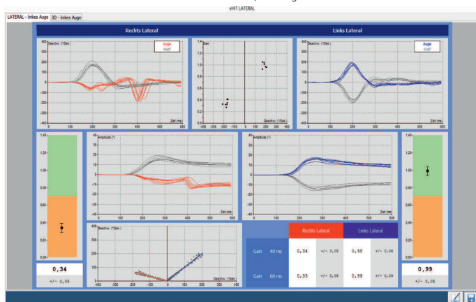
(Abb. zeigt eine Standard vHit lateral Messung mit einer hochgradigen Schädigung rechts)

Die Kamera kann wahlweise das linke oder das rechte Auge analysieren. Dies bietet ein hohes Maß an Flexibilität. Es besteht die Möglichkeit, das System zu einem Video- Nystagmographie System zu erweitern. Hierbei kann dann, mit dem selben System, auch noch der Spontannystagmus, eine Lage- / Lagerungsuntersuchung, sowie eine kalorische Untersuchung durchgeführt werden. Alle Untersuchungsergebnisse werden, mit einer sehr leicht zu bedienenden Software, in einer Datenbank gespeichert.